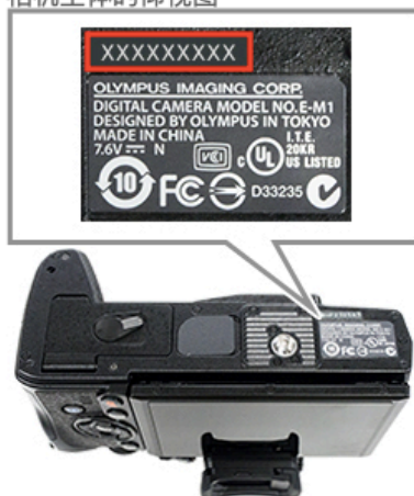
相机主体的仰视图

http://support.olympus-imaging.com/oc1download/download